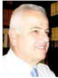
Γράφει ο ΑΝΑΣΤΑΣΙΟΣ ΒΑΣΙΛΙΑΔΗΣ

Ενώ τα έντονα γεγονότα που βίωσε η χώρα μας τους καλοκαιρινούς μήνες, όπως οι καταστροφικές πυρκαγιές στην Αττική και αλλού, η απελευθέρωση των κρατούμενων στρατιωτικών μας στην Τουρκία, ο κυβερνητικός ανασχηματισμός, καθώς και άλλα σημαντικά συμβαίνοντα, εξακολουθούν να απασχολούν το ενδιαφέρον των πολιτών, ο προσανατολισμός της κοινής γνώμης στρέφεται στα αποτελέσματα των εισαγωγικών εξετάσεων στα Ανώτατα και Τεχνολογικά Εκπαιδευτικά Ιδρύματα της χώρας, που ήδη ανακοινώθηκαν.