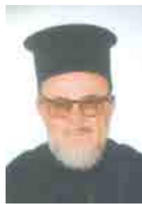
Του ιερέως Παναγιώτου Σ. Χαλκιά

Ο γνωστός αρνητής και πολέμιος του Χριστιανισμού Ερνέστος Ρενάν (1823-1892), φίλοι αναγνώστες, έγραψε, πριν από 128 περίπου χρόνια, στο βιβλίο του «Το μέλλον της επιστήμης (1890)»: «Ο θάνατος ενός Γάλλου είναι ένα γεγονός στον ηθικό κόσμο. Ο θάνατος ενός Κοζάκου δεν είναι παρά το φυσιολογικό συμβάν: μια μηχανή λειτουργούσα, που δεν λειτουργεί πια».