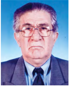
Γράφει ο Παναγιώτης Παπαδόπουλος Φιλολόγος

Τελείωσαν μαζί με τις εκλογές οι ομιλίες και οι συγκεντρώσεις των ελληνικών κομμάτων και των υποψηφίων Βουλευτών της ελληνικής Βουλής. Οι έλληνες ψηφοφόροι απάντησαν με την ψήφο τους και κατένειμαν τους ρόλους τους στην πολιτική για τη διακυβέρνηση της χώρας. Άλλα κόμματα επιβραβεύθηκαν και κάποια άλλα μείωσαν τις δυνάμεις τους. Όλα λειτούργησαν ομαλά στις εκλογές με την υπηρεσιακή κυβέρνηση των προσσωπικότητας. Είναι το σχήμα του Υπουργικού Συμβουλίου προσωπικότητας της Εκτελεστικής Εξουσίας που από χρόνια προσπαθώ να κάνω γνωστό. Πριν λίγες μέρες ορκίστηκαν οι νεοεκλεγέντες Πρωθυπουργός κ. Κυριάκος Μητσοτάκης και οι Υπουργοί της νέας κυβέρνησης και αμέσως έσπευσαν να παραλάβουν τα χαρτοφυλάκια τους. Αναρωτιέμαι πόσος χρόνος χρειάζεται σε κάποιο Υπουργείο π.χ. Εξωτερικών για να ενημερωθεί για τα επίκαιρα θέματα, κυρίως, ώστε με τόση ευκολία είναι επαρκής για να αντιμετωπίσει τα γεράκια της απέναντι πλευράς. Ήταν, πάντως, για τους υπουργούς κατά την ώρα της ορκωμοσίας, ομολογώ, συγκινητική η ατμόσφαιρα με την παρουσία των οικογενειών των. Τώρα ο έλληνας πολίτης περιμένει να δει αν εκείνες οι υποσχέσεις θα γίνουν πραγματικότητα. Θέματα εθνικά, οικονομικά, κοινωνικά, υγείας, παιδείας και εξωτερικής πολιτι-