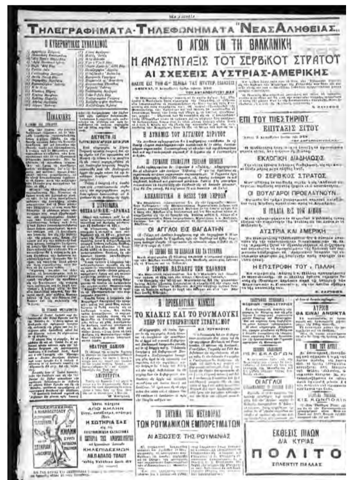
ΝΕΑ ΑΛΗΘΕΙΑ 6/12/1915 ΨΗΦΟΔΕΛΤΙΟ ΘΕΣΣΑΛΟΝΙΚΗΣ

(III).- Για την πληρότητα της παρουσίασης και την τεκμηρίωση των παρατιθέμενων στοιχείων, συναποστέλλονται: