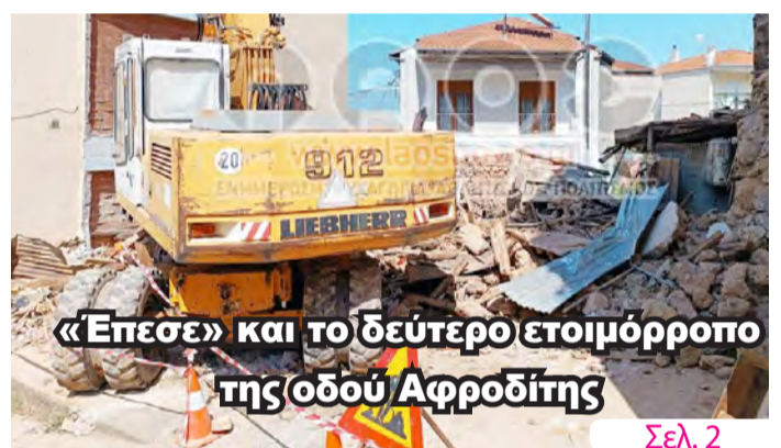
«Έπεσε» και το δεύτερο ετοιμόρροπο της οδού Αφροδίτης