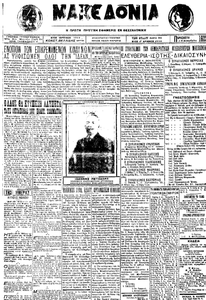
ΜΑΚΕΔΟΝΙΑ 14/12/1923 ΒΕΡΟΙΑ ΕΚΛΟΓΕΣ