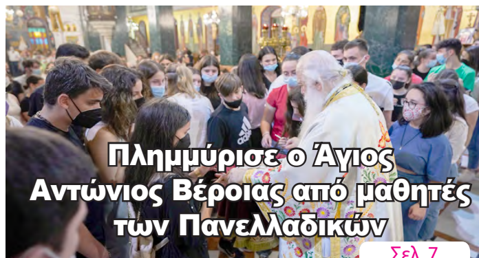
Πλημμύρισε ο Άγιος Αντώνιος Βέροιας από μαθητές των Πανελλαδικών