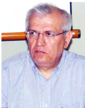
Μόνο ένας ασθενής από κορωνοϊό στο Νοσοκομείο Βέροιας!