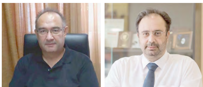
Μηνύματα από τον Δήμαρχο Βέροιας και τον Δ/ντη Δ.Δ.Ε. Ημαθίας για τις Πανελλαδικές εξετάσεις