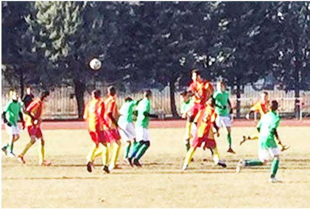
Ένα ακόμη γεμάτο αγωνιστικό Σαββατοκύριακο για τα τμήματα υποδομών του ΝΠΣ ΒΕΡΟΙΑ!