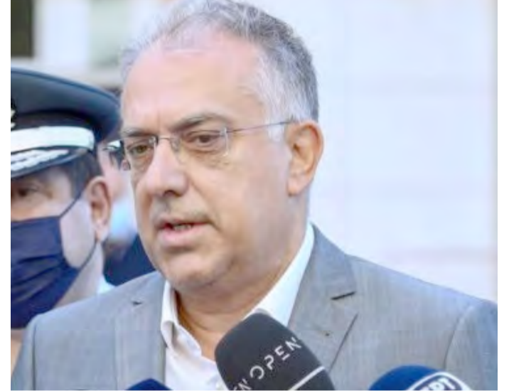
Δημιουργούνται ειδικά «σχολεία μετεκπαίδευσης» των ειδικών φρουρών. Η δράση αυτή ξεκινά 01/12/2021 και ολοκληρώνεται ως τις 30/09/2022 για την ομάδα ΔΙΑΣ.

2. Διασφάλιση της συνεχούς επανεκπαίδευσης του συνόλου των αστυνομικών με προτεραιότητα τους αστυνομικούς που υπηρετούν στην Ομάδα ΔΙΑΣ, οι οποίοι διαχειρίζονται μεγάλο εύρος θεμάτων ασφάλειας και αστυνόμευσης στην υπηρεσία του πολίτη. Τόσο στο επιχειρησιακό πεδίο, όσο και στην επικοινωνία με τους πολίτες και τη γνώση των Νόμων.