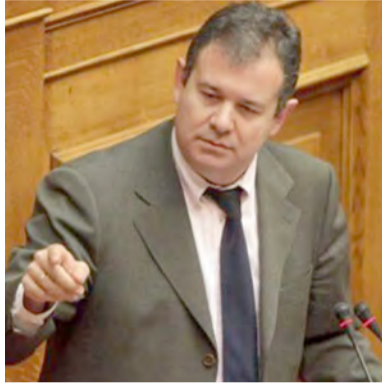
Του Κωνσταντίνου Γιοβανόπουλου*

Οι Έλληνες ήμασταν ανέκαθεν λαός ναυτικός. Από τη Μικράσια στην Αλεξάνδρεια κι από την Κάτω Ιταλία στα μίλα των Εσπερίδων, οργώναμε τα κύματα χτίζοντας προκομμένες γειτονιές. Στων καρabiών τις πλώρες μαθαίναμε τον ουρανό, πλανήτες είχαμε για οδηγούς, μες στην καρδιά μας ένας Οδυσσεύς τραβούσε το κουπί.