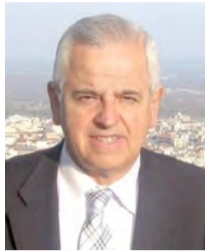
Του Αναστάσιου Βασιάδη

Και μόνο το γεγονός ότι μια επαρχιακή ημερήσια εφημερίδα συμπλήρωσε πενήντα επτά χρόνια έκδοσης, αποτελεί μια περιφανή νίκη του ημερήσιου επαρχιακού τύπου συνολικώς, για την οποία δικαιούται να πανηγυρίζει ολόκληρος ο κοινωνικός περίγυρος.