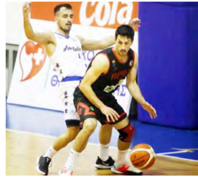
Θει εκ των έσω.

Στην μνήμα του... Η παρακαταθήκη που αφήνει στο μπάσκετ της Βορείου Ελλάδας μεγάλη. Ο άνθρωπος που άλλαξε το ρου της ιστορία του Φίλιππου Βέροιας δεν είναι πια ανάμεσα μας. Όμως, άπαντες στην Βέροια έχουν συσπειρωθεί και θέλουν να τον τιμήσουν διατηρώντας την ομάδα σε εξαιρετικά επίπεδα. Το βλέπουν ως... χρέος τους. Δεν θα