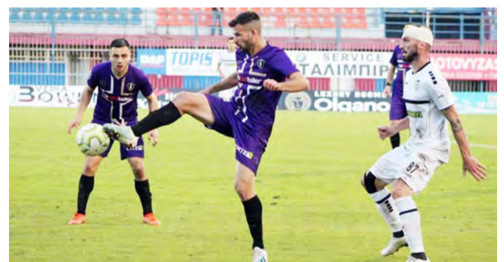
Βουζουνεράκειο, ΟΦ ΙΕΡΑΠΕΤΡΑΣ – ΤΡΙΚΑΛΑ

Αναλυτικά: Σάββατο 7/3 (15:00), ΕΡΤ3 Στ. Μαυροθαλασσίτης, ΑΙΓΓΑΛΕΩ – ΘΕΣΠΡΩΤΟΣ Οικονομίδειο, ΙΑΛΥΣΟΣ – ΕΝΩΣΗ ΑΣΠΡΟΠΥΡΓΟΥ