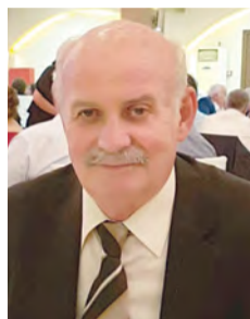
Επιμέλεια: Μάκης Δημητράκης

Η αγία (Οσιομάρτυρας) Ιερουσαλήμ που σήμερα τιμάται η μνήμη της γεννήθηκε και μεγάλωσε στην Αλεξάνδρεια της Αιγύπτου πιθανόν τον 3ο μ.Χ. αιώνα. Είχε πλούσια καταγωγή και οι χριστιανοί γονείς της φρόντισαν για την ανάλογη ανατροφή της.