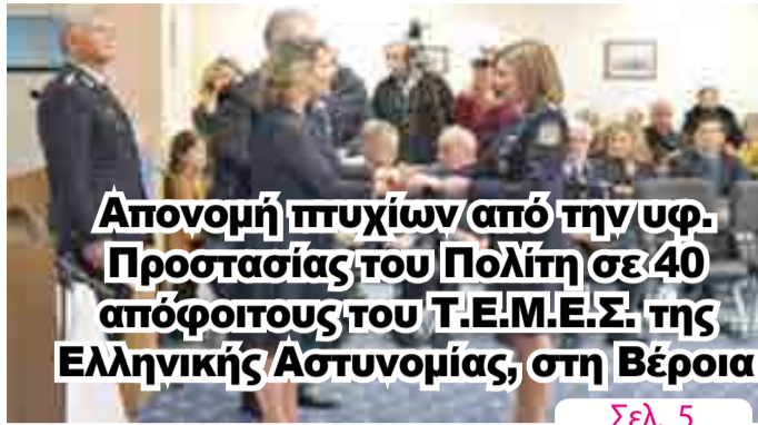
Απονομή πτυχίων από την υφ. Προστασίας του Πολίτη σε 40 απόφοιτους του Τ.Ε.Μ.Ε.Σ. της Ελληνικής Αστυνομίας, στη Βέροια