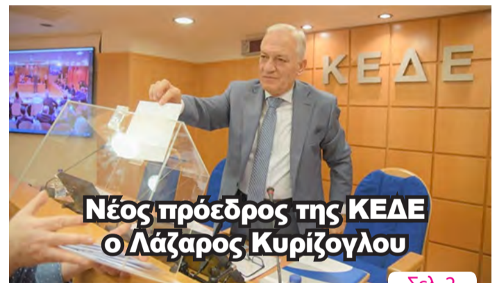
Νέος πρόεδρος της ΚΕΔΕ ο Λάζαρος Κυριζογλου