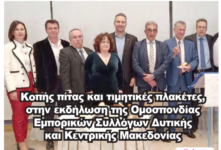
Κοπής πίτας και τιμητικές πλακέτες, στην εκδήλωση της Ομοσπονδίας Εμπορικών Συλλόγων Δυτικής και Κεντρικής Μακεδονίας

ΑΔΕΣΜΕΥΤΗ ΚΑΘΗΜΕΡΙΝΗ ΕΦΗΜΕΡΙΔΑ ΤΟΥ ΝΟΜΟΥ ΗΜΑΘΙΑΣ