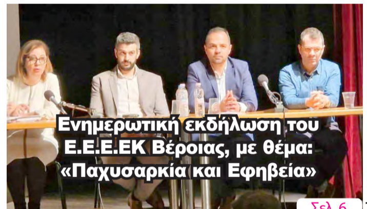
Ενημερωτική εκδήλωση του Ε.Ε.Ε.ΕΚ Βέροιας, με θέμα: «Παχυσαρκία και Εφηβεία»