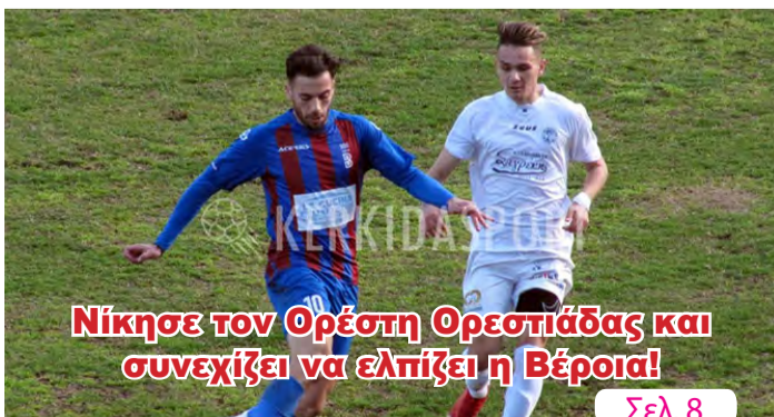
Νίκησε τον Ορέστη Ορεσιτιάδας και συνεχίζει να ελπίζει η Βέροια!