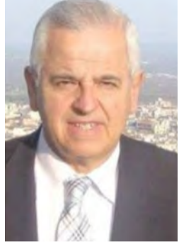
Του Αναστάσιου Βασιιάδη

Με αφορμή την Παγκόσμια Ημέρα Αδέσποτων Ζώων, επανέρχεται στο προσκήνιο ένα χρόνιο ζήτημα με σαφείς υγειονομικές, αισθητικές και πολιτισμικές παραμέτρους.