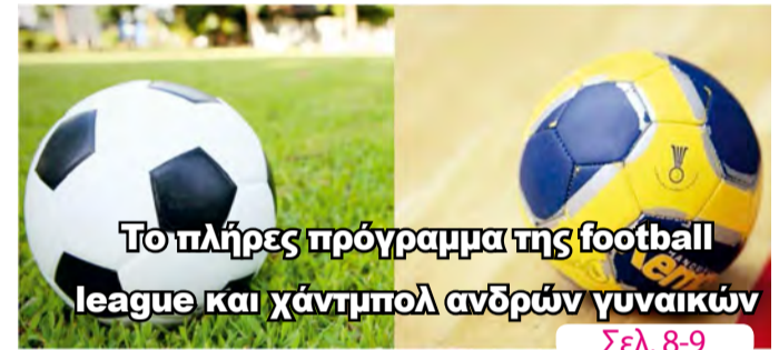
Το πλήρες πρόγραμμα της football league και χάντμπολ ανδρών γυναικών