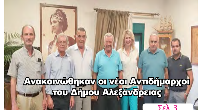
Ανακοινώθηκαν οι νέοι Αντιδήμαρχοι του Δήμου Αλεξάνδρειας

ΑΔΕΣΜΕΥΤΗ ΚΑΘΗΜΕΡΙΝΗ ΕΦΗΜΕΡΙΔΑ ΤΟΥ ΝΟΜΟΥ ΗΜΑΘΙΑΣ