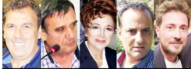
Ορίστηκαν οι αντιδήμαρχοι στη Νάουσα και την Κυριακή εκλέγεται προεδρείο και μέλη επιτροπών