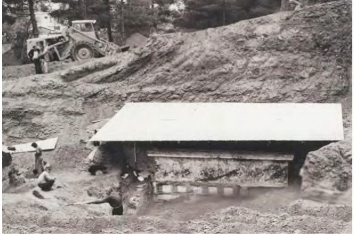
Βεργίνα (1977): Το πρόχειρο στέγαστρο που στήθηκε στην πλαγιά της Τούμπας, για την προστασία του Μακεδονικού τάφου που μόλις είχε αποκαλυφθεί (από το φωτ. αρχείο της ανασκαφής)

Με την ολοκλήρωση της εκλογικής διαδικασίας, η επικαιρότητα του Νοεμβρίου του 1977, έστω και για το δεκάημερο που απέμενε, μπορούσε να ξεφύγει από τα θορυβώδη πολιτικά νέα των 20 πρώτων ημερών του μήνα παρότι σχολιάζονταν ποικιλότητα η καθυστέρηση της ορκωμοσίας της νέας Κυβέρνησης. Η αργοπορία στην τελική καταμέτρηση των σταυρών (κυρίως στην Αττική)