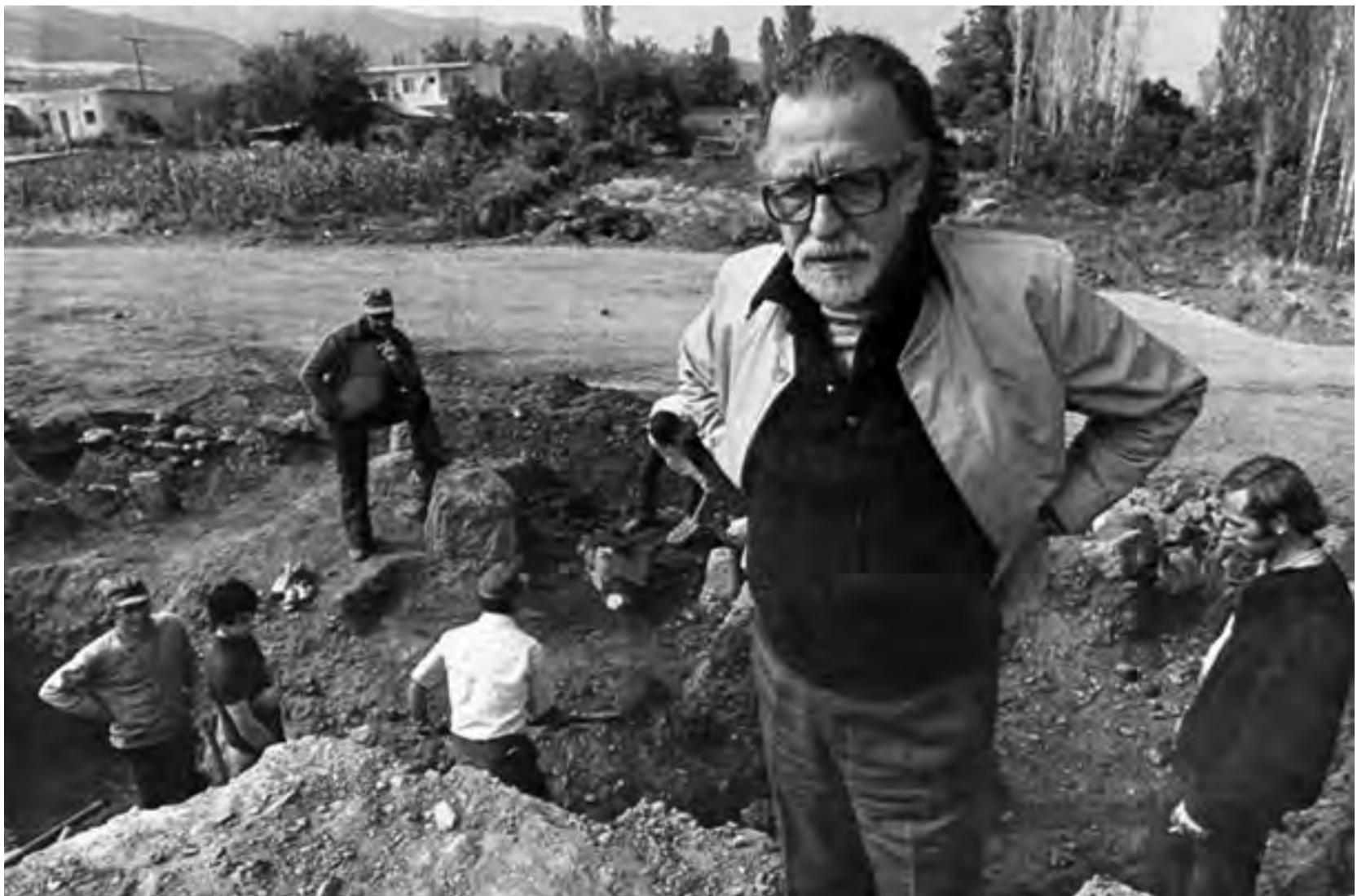
Βεργίνα (1977): Ο Ανδρόνικος στην ανασκαφή