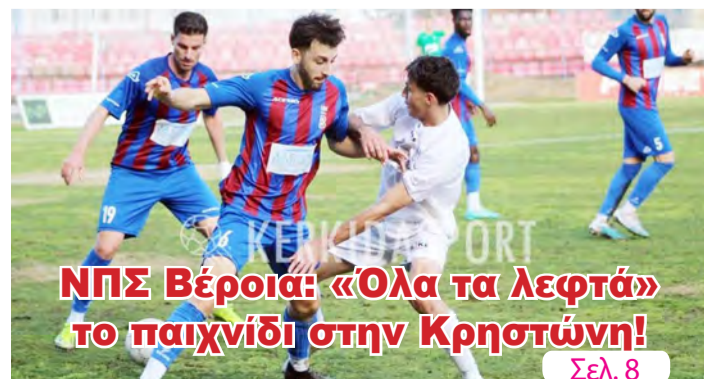
ΝΠΣ Βέροια: «Όλα τα λεφτά» το παιχνίδι στην Κρηστώνη!