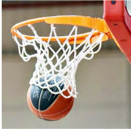
Εκ Φρυγανιώτη-Κου.Πα. Κιλκίς ..... 78-68 Αργος Ορεστικό-ΓΣ Αλμυρού .....53-67

Αετοί Βέροιας (Αλμπάνης): Μπρούκς 9(1), Δαχρέτζης 8(2), Γάτσος 4, Σαχμπατιάν 10, Παπαδόπουλος 17(1), Κόκκινος 11(1), Νικάι 2, Ιωσηφίδης 2, Μητακίδης, Κούντας, Σαζακλίδης 4, Πάππου.