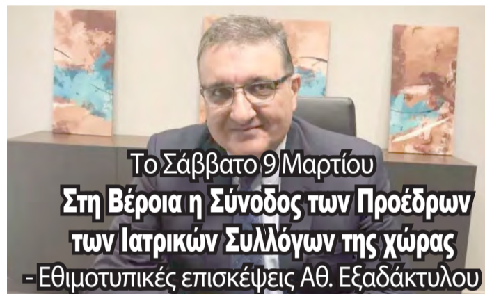
Το Σάββατο 9 Μαρτίου Στη Βέροια η Σύνοδος των Προέδρων των Ιατρικών Συλλόγων της χώρας - Εθιμοτυπικές επισκέψεις Αθ. Εξαδάκτυλου

Τζίτζικώστας: Η ΕΝΠΕ θα συμβάλει με συγκεκριμένες και στοχευμένες παρεμβάσεις