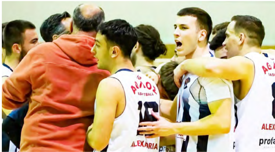
Αιγινιακός – ΓΑΣ Μ. Αλέξανδρος Γιαν ΑΟΚ Ίκαροι Γιανν – ΑΕΚ Βατανιακός Σάρισα ΑΟΚ Βέροιας – ΜΠΑΣ Εργόναθλος ΑΓΕ Πιερίας – Εδεσσαϊκός ΣΚ

Ο Άθλος Αλεξάνδρειας έκανε το πρώτο βήμα κερδίζοντας εύκολα με 73-55 τον Αετό Κιλκίς, ενώ ο ΑΟΚ Βέροιας δεν τα κατάφερε στο Πολύκαστρο όπου ηττήθηκε με 76-50 από τον Εργόναθλο.