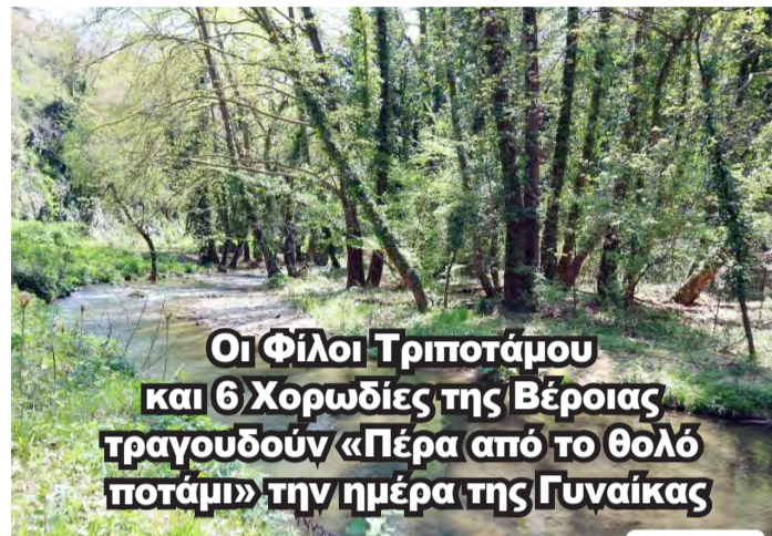
Οι Φίλοι Τριποτάμου και 6 Χορωδίες της Βέροιας τραγουδούν «Πέρα από το θολό ποτάμι» την ημέρα της Γυναίκας

ΑΔΕΣΜΕΥΤΗ ΚΑΘΗΜΕΡΙΝΗ ΕΦΗΜΕΡΙΔΑ ΤΟΥ ΝΟΜΟΥ ΗΜΑΘΙΑΣ