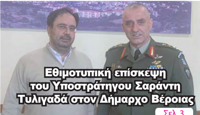
Εθιμοτυπική επίσκεψη του Υποστράτηγου Σαράντη Τυλιγαδά στον Δήμαρχο Βέροιας