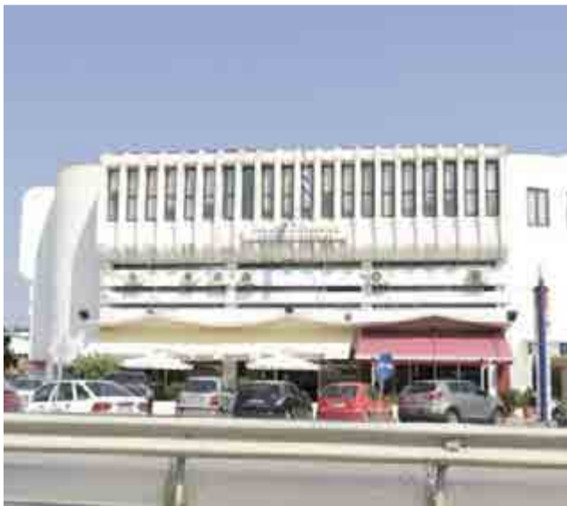
Η Δ.Ο.Υ Βέροιας την Τρίτη 6 Νοεμβρίου 2018 θα είναι ανοιχτή για το κοινό μέχρι τις 9 π.μ. λόγω της ετήσιας τακτικής Συνέλευσης του συλλόγου εργαζομένων στις Δ.Ο.Υ Ημαθίας – Πέλλας – Πιερίας.

Σήμερα Τρίτη Ετήσια Γενική συνέλευση εργαζομένων στις Δ.Ο.Υ Ημαθίας –Πέλλας-Πιερίας -Κλειστή μετά τις 9.00 π.μ. η ΔΟΥ Βέροιας