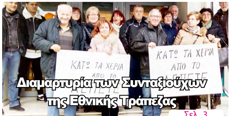
Διαμαρτυρία των Συνταξιούχων της Εθνικής Τράπεζας