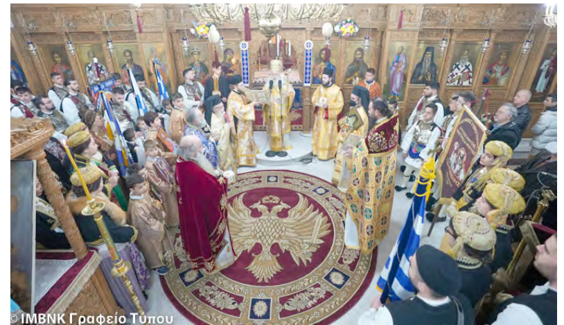
IMBNK Γραφείο Τύπου