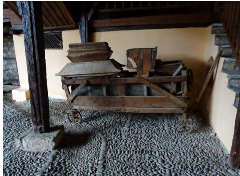
Απόψεις από την αυλή του αρχοντικού Σαράφογλου

Τα υπόγεια χρησίμευαν κυρίως ως αποθηκευτικοί χώροι. Στο ισόγειο βρισκόταν απαραίτητως η εσωτερική αυλή με βοτσαλό-