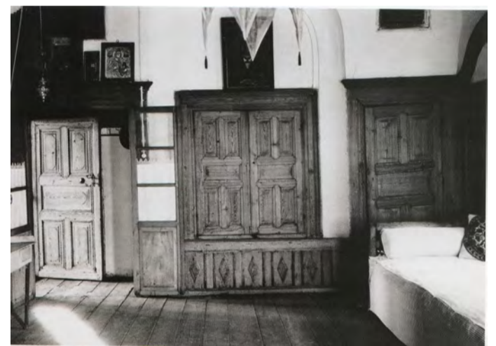
Άποψη από το εσωτερικό του αρχοντικού της Ρακιβανούδας

Στους ορόφους υπήρχαν οι «οντάδες» τα δωμάτια διαμονής-ύπνου με τις χαρακτηριστικές «μουσάντρες» (μεγάλες εντοιχισμένες ντουλάπες), περιφερειακά ενός ανδροκρατούμενου κατά κύριο λόγο μεγάλου κεντρικού χώρου υποδοχής και διασκέδασης, το «τζαμεκιάν» ή ο «δοξάτος». Οι καθημερινές οικογενειακές συγκεντρώσεις γινόταν σε ένα υπερυψωμένο δευτερεύον καθιστικό (το «μιντέρι»), συνήθως διαχωρισμένο από τον «δοξάτο» με ξύλινα κιγκλιδώματα και καφασωτά πλέγματα, πίσω από τα οποία κρυφοκοιτούσαν τα κορίτσια τα απαγορευμένα γι' αυτά γλέντια των ανδρών. Μια ξύλινη φαρδιά σκάλα, η οποία κατέληγε πάντοτε στον κεντρικό χώρο υποδοχής, ήταν ο σύνδεσμος ισογείου και ορόφων.