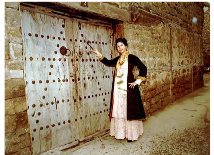
Στην είσοδο της οικίας Βλαχογιάννη - κατ' άλλους οικίας Χριστοδούλου.