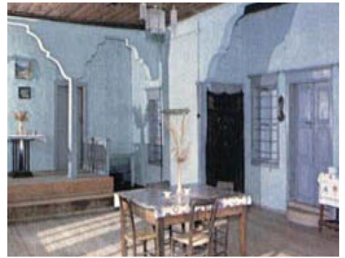
Άποψη από το εσωτερικό του αρχοντικού Σαράφογλου