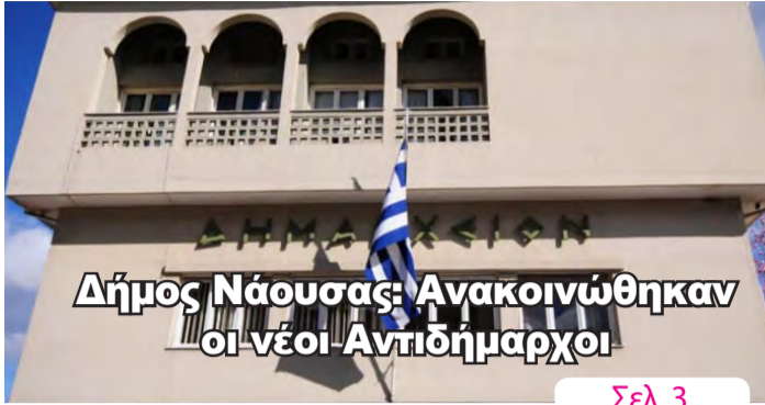
Δήμος Νάουσας: Ανακοινώθηκαν οι νέοι Αντιδήμαρχοι