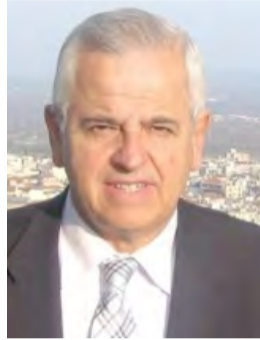
Γράφει ο Αναστάσιος Βασιάδης

Εν μέσω της επιδημικής κρίσης είναι εύλογη και απολύτως δικαιολογημένη η γενικότερη προσδοκία για το αναμενόμενο εμβόλιο κατά του κορωνοϊού.