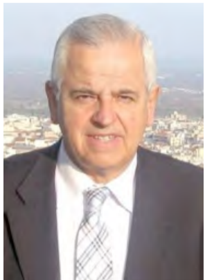
Γράφει ο Αναστάσιος Βασιιάδης

Η επικαιρότητα της συζήτησης επί των κυβερνητικών προγραμματικών δηλώσεων στη Βουλή, που θα έπρεπε να κυριαρχεί λόγω της βαρυσήμαντης για το μέλλον του τόπου σημασίας της, υπολείπεται σε δημοσιότητα λόγω των πυρκαγιών που βρίσκονται σε εξέλιξη κατά την τρέχουσα θερινή περίοδο, ενώ επαναφέρεται με ιδιαίτερη έμφαση το διαχρονικό και πολυσήμαντο ζήτημα της δασοπροστασίας, από τις μόνι-