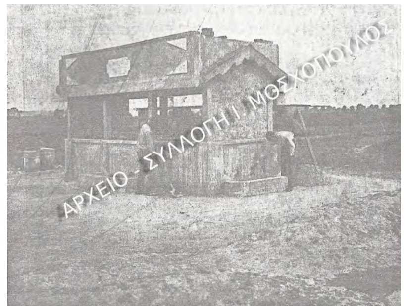
Καταιονιστήρ ύδατος ή «υποβρύχιο» Γιδά.