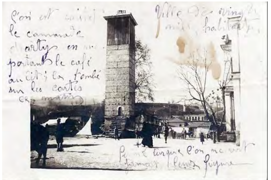
Βεροία, 1918, ρολόι... δεξιά η πρόσοψη των Δικαστηρίων. Μία άλλη εικόνα, μία άλλη εποχή!

Επιμέλεια: Στέργιος Ζυγουλιάνος – Συλλέκτης Φωτογραφιών