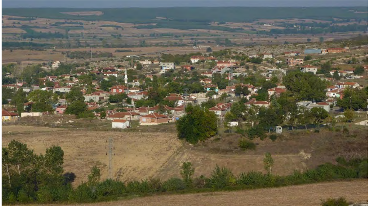
Ο ναός της Αγίας Σοφίας στην Βιζύη της Ανατολικής Θράκης