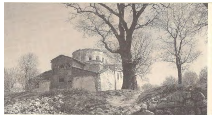
Η Αγία Σοφία Βιζύης όπως σώζεται στο επάνω κίστρο της άλλοτε οχυρής Πολιτείας των Βυζαντινών (Προποντίδα. Εκδόσεις Λούση Μπρατζιώτη).