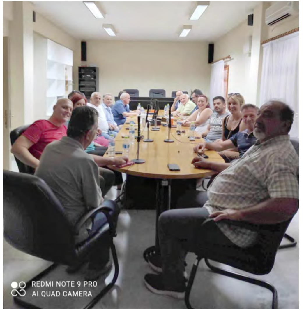
REDMI NOTE 9 PRO AI QUAD CAMERA

Επίσης θα κατασκευαστούν στα πλαίσια του έργου δύο αντλιοστάσια πλήρως εξοπλισμένα.