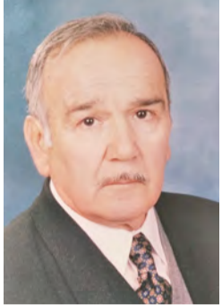
Γράφει ο Θωμάς Γαβριηλίδης