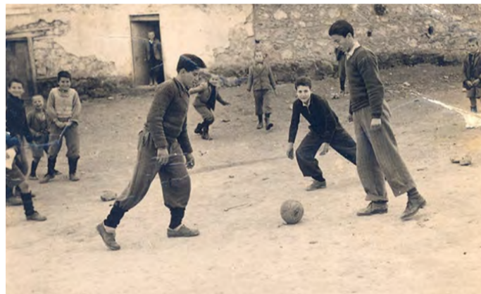
Ποδοσφαιρικός αγώνας σε αλάνα