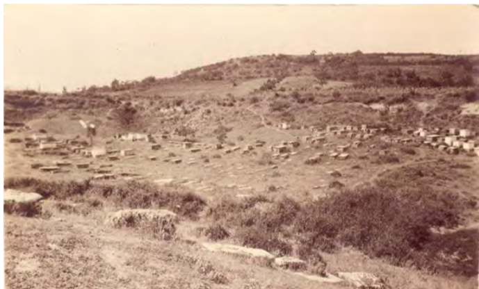
Το εβραϊκό κοιμητήριο, πριν την ανάπτυξη της περιοχής