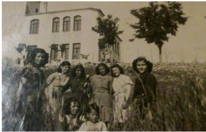
Μπροστά από την τούμπα του 5ου Δημοτικού Σχολείου Βέροιας τη δεκαετία το '50 (Αρχειό Ευφροσύνης Κοιμτζόγλου)