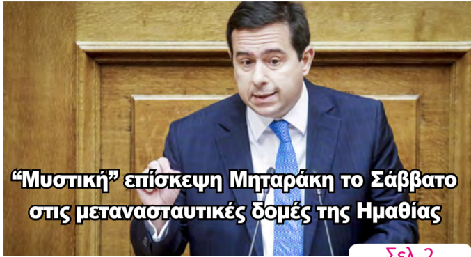
“Μυστική” επίσκεψη Μητράκη το Σάββατο στις μετανασταυτικές δομές της Ημαθίας