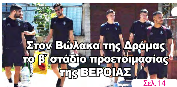
Στον Βώλακα της Δράμας το β' στάδιο προετοιμασίας της ΒΕΡΟΙΑΣ