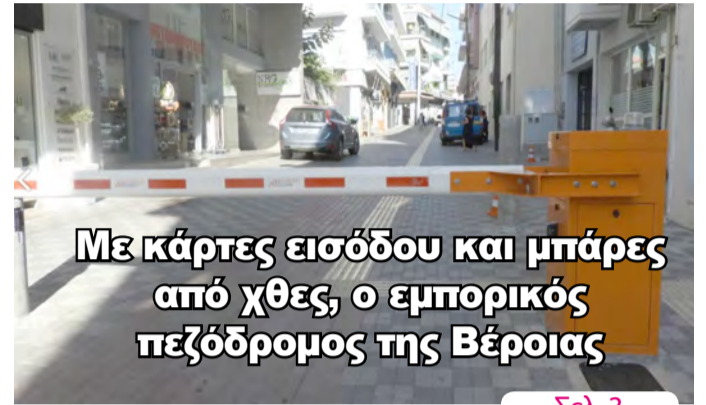
Με κάρτες εισόδου και μπάρες από χθες, ο εμπορικός πεζόδρομος της Βέροιας

ΑΔΕΣΜΕΥΤΗ ΚΑΘΗΜΕΡΙΝΗ ΕΦΗΜΕΡΙΔΑ ΤΟΥ ΝΟΜΟΥ ΗΜΑΘΙΑΣ