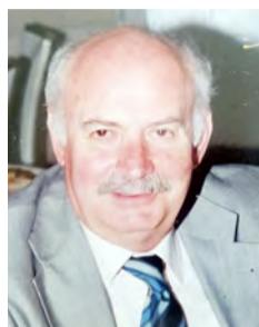
Του Μάκη Δημητράκη

Λίγοι ίσως Βεροιώτες –καλά πληροφορημένοι- γνώριζαν μέχρι πριν λίγο καιρό την ιστορία της δημιουργίας της Δημοτικής Αγοράς στο κέντρο της πόλης.