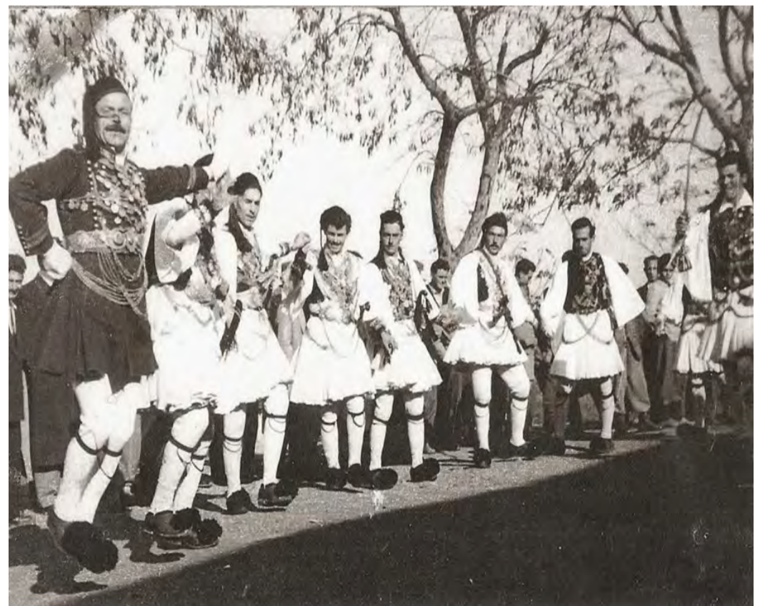
Ρουγκατσία Βερμίου 1955

Διακρίνονται στην πρώτη σειρά και οι μικροί. Μεν. Χατζηνικολάκης, Alfonso Petsioti.