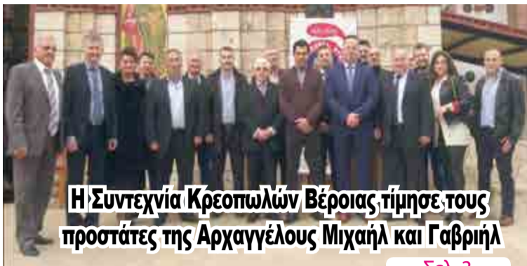
Η Συντεχνία Κρεοπωλών Βέροιας τίμησε τους προστάτες της Αρχαγγέλου Μιχαήλ και Γαβριήλ