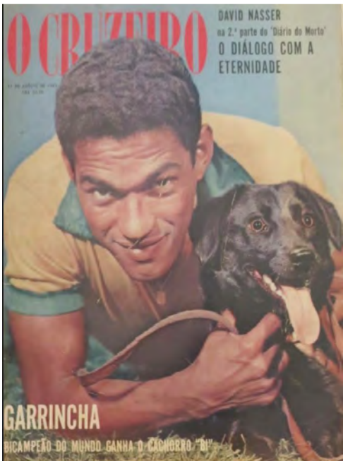
Ο Γκαρίντσα και ο Βι ποζάρουν σε εξώφυλλο περιοδικού

Τελικά, ο «Βι» υιοθετήθηκε από τον σούπερ star της εποχής, τον βραζιλιάνο επιθετικό Μανέ Γκαρίντσα (τον «κουτσό» Πελέ για τον οποίο γράψαμε τις προάλλες). Και κάπως έτσι, ο σκύλος πέρασε ευτυχισμένος τα υπόλοιπα χρόνια της ζωής του, στην αυλή ενός βραζιλιάνικου σπιτιού που ήξερε να λατρεύει το ποδόσφαιρο και όλους τους πρωταγωνιστές του, είτε είχαν δύο πόδια, είτε τέσσερα.