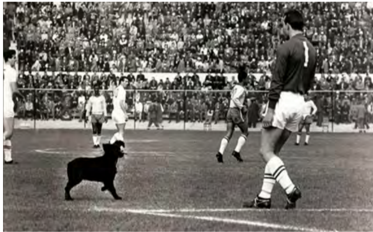
Η είσοδος του Βι στον αγώνα Αγγλίας - Βραζιλίας

Ήταν μια εποχή που οι ποδοσφαιρικές ομάδες δεν διέθεταν «δεύτερη» φανέλα. Η φανέλα ήταν μια και καλή που τη φορούσαν μέχρι το τέλος του αγώνα, είτε γίνονταν μούσκεμα, είτε γέμιζε λάσπη, είτε σκίζονταν. Έτσι ο Άγγλος ποδοσφαιριστής υποχρεώθηκε να συνεχίσει τον αγώνα έχοντας στο κορμί του, τα ίχνη και τις μυρωδιές του σκύλου που είχε μεταφέρει εκτός αγωνιστικού χώρου.