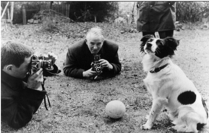
Ο διάσημος Πικλς ποζάροντας σε φωτογράφιση

Όλο το γήπεδο χειροκρότησε την πράξη του Γκρίβς όμως καθώς ο Άγγλος έτρεχε να βγάλει το σκυλί εκτός γηπέδου, αυτό μάλλον από την ταραχή του, κατούρησε επάνω του.