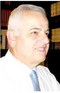
Γράφει ο ΑΝΑΣΤΑΣΙΟΣ ΒΑΣΙΛΙΔΗΣ