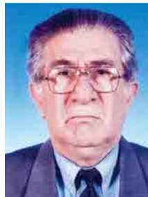
Γράφει ο Παναγιώτης Παπαδόπουλος Φιλολόγος

«Ο κίνδυνος έρχεται ταχύτερα όταν περιφρονείται» Ευριπίδης