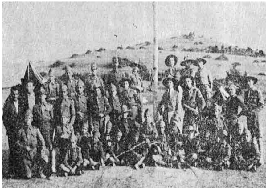
Πρόσκοποι: 26 Σύνολο Βαθμοφόρων και Προσκόπων = 75