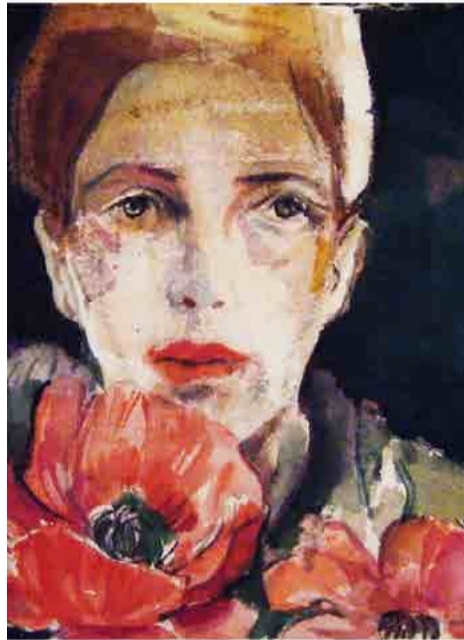
Κόκκινες παπαρούνες, 2018, ακουαρέλα

Πληροφορίες: Εφορεία Αρχαιοτήτων Ημαθίας, 23310 29737, efahma@culture.gr