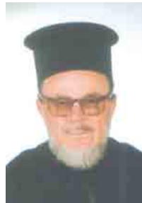
Του Ιερέως: Παναγιώτου Σ. Χαλκιά

Πριν αναπτύξω το σημερινό μου θέμα, φίλοι αναγνώστες, θα σας διηγηθώ κάτι σχετικό, που άκουσα ο ίδιος.