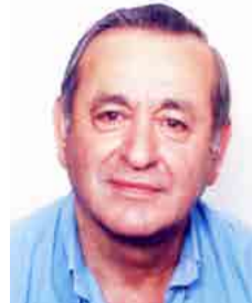
Γράφει ο Πάυλος Πυρινός

Ο ΠΡΟΣΚΟΠΙΣΜΟΣ ΣΤΗΝ ΒΕΡΟΙΑ 1933-1935 ΝΕΑ ΠΡΟΣΠΑΘΕΙΑ ΑΝΑΔΙΟΡΓΑΝΩΣΗΣ ΤΗΣ ΤΟΠΙΚΗΣ ΕΦΟΡΕΙΑΣ 1933