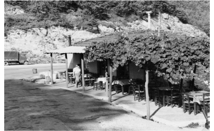
Το εστιατόριο Γρα-Γρου χτίστηκε το 1925. Αρχικά ήταν χάνι, έπειτα κουρείο και τελικά έγινε εστιατόριο ονομαστό στη Βόρεια Ελλάδα. Η χαρακτηριστική ονομασία δόθηκε γιατί στο σημείο εκείνο τα βαριά αυτοκίνητα έπρεπε να κατεβάσουν ταχύτητα και το σασμάν έκανε τον γνωστό θόρυβο "γρρρρρρ".