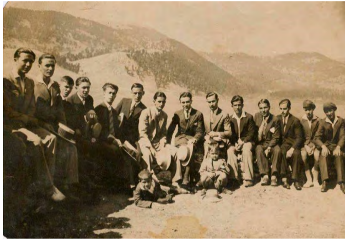
Παραθεριστές στο Ξηρολίβαδο-1920

«...η νόσος εξαπλούται προσβάλλουσα υπάρξεις από της καλύβης του πτωχού, μέχρι του πολυτελέστατου μεγάρου του πλουσίου. (...) Η νόσος αλματωδώς μεταδίδεται και η θνησιμότης εκ της φθίσεως καταπληκτικώς αυξάνει, εις τούτο συμφωνούν όλοι οι συνάδελφοι, αυτό αποδεικνύει η τριετής στατιστική του Νοσοκομείου, αυτό μας λέγει το ληξιαρχικόν βιβλίον του Δήμου...» (Αστήρ Βερροίας Αρ.Φ. 57 – 12 Ιουλίου 1927).