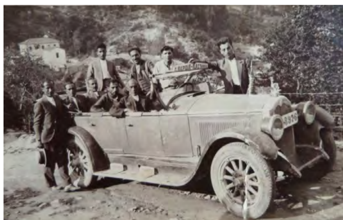
Το «λεωφορείο» που εκτελούσε την διαδρομή ΒΕΡΟΙΑ-ΚΑΣΤΑΝΙΑ ιδιοκτησίας Γεώργιου Τσιρίδη