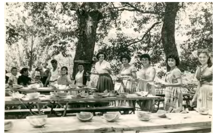
Προετοιμασίες γεύματος στη μαθητική κατασκήνωση του Κωστοχωρίου

Θα παρατηρήσατε ασφαλώς ότι δεν γίνονταν καθόλου λόγος για παραθαλάσσιους προορισμούς, σε αντίθεση με τη σύγχρονη τάση κι αυτό γιατί τα "θαλάσσια λουτρά" γίνονταν τότε μόνο με "ιατρική συνταγή" !!! Όπως μας διασώζει ο Στέφανος Ζάχος στις Αναμνήσεις ενός Βεροϊώτη: «...Έπρεπε ο αλυσμόνητος γιατρός Νικολούσης, ο πατέρας των Αντώνη και Σόλωνος Αντωνιάδη, (...) να συστήσει τα μπάνια, να καθορίσει τον αριθμό, δεκαπέντε ως είκοσι, την διάρκεια της παραμονής στη θάλασσα, τις πρώτες μέρες δέκα λεπτά, τις μετέπειτα δεκαπέντε και τις τελευταίες εικοσιπέντε...»