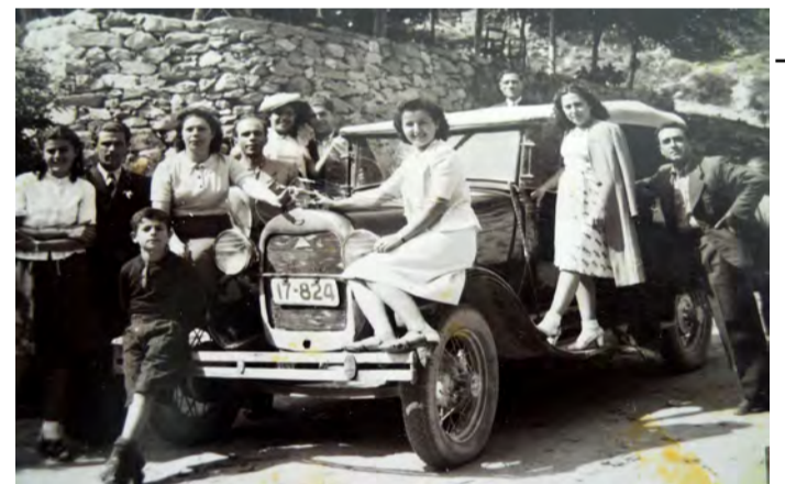
Παραθεριστές στην Καστανιά-1938