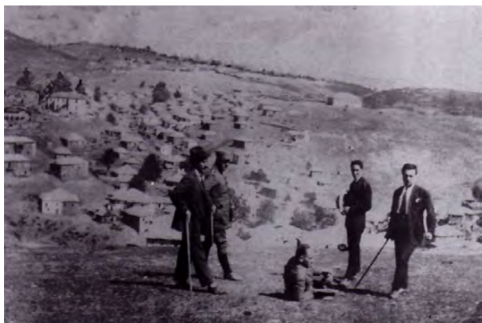
Παραθεριστές στο Σέλι-1922 (Από το βιβλίο του Α.Τζίμα "Η Κιβωτός των Βλάχων του Σελίου")

Η πραγματικά γενεσιουργός αιτία όμως όλης αυτής της παραθεριστικής παραζάλης δεν είχε καμία σχέση με τη σύγχρονη περί διακοπών σκέψη, αλλά... με την τρομερή εξάπλωση της φθίσεως (προθάλαμος της φυματίωσης) στην πόλη μας. Κατά τη διατύπωση του τότε επιφανούς ιατρού του «Προσφυγικού Νοσοκομείου Βέροιας» κ. Σ. Μουράτογλου: