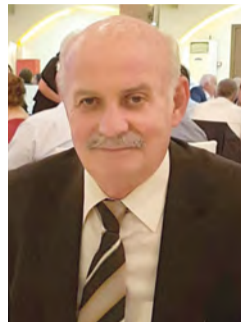
Γράφει ο Μάκης Δημητράκης

Δεκαπενταύγουστος! Της Παναγιάς! Τρανή γιορτή και όλη η Ελλάδα, απ' άκρη σ' άκρη γιορτάζει και ειδικά το Βέρμιο που προσελκύει πιστούς κάθε ράτσας που α-