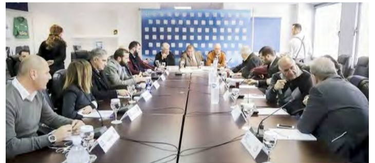
ΑΤΡΟΜΗΤΟΣ ΑΘΗΝΩΝ ΠΕΜΠΤΗ 31/01/2019 19:00 Α.Ο. ΞΑΝΘΗ - ΑΡΗΣ

Η Super League ανακοίνωσε τις ημέρες και τις ώρες των αγώνων της εμβόλιμης 15ης αγωνιστικής, ενώ έγινε μια αλλαγή και στο πρόγραμμα της 19ης. Διαβάστε αναλυτικά. Το διήμερο 30-31 Ιανουαρίου θα πραγματοποιηθεί η εμβόλιμη 15η αγωνιστική του πρωταθλήματος της Super League Σουρωτή, η οποία είχε αναβληθεί μετά την αποχή των διαιτητών για τον ξυλοδαρμό του Θανάση Τζήλου.