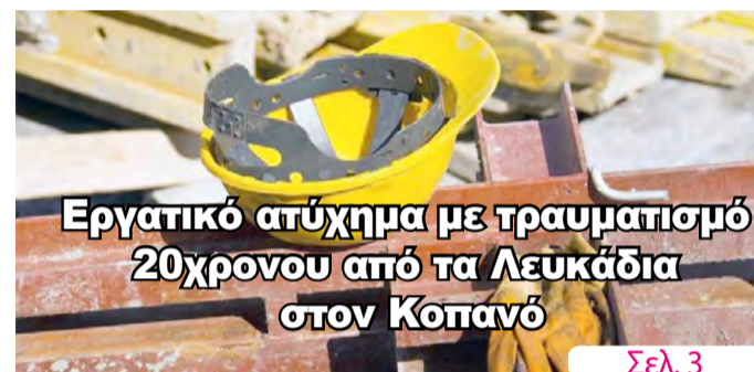
Εργατικό ατύχημα με τραυματισμό 20χρονου από τα Λευκάδια στον Κοπανό