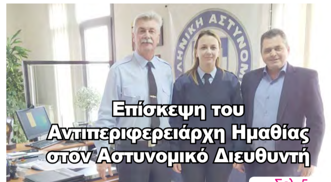
Επίσκεψη του Αντιπεριφερειάρχη Ημαθίας στον Αστυνομικό Διευθυντή

ΑΔΕΣΜΕΥΤΗ ΚΑΘΗΜΕΡΙΝΗ ΕΦΗΜΕΡΙΔΑ ΤΟΥ ΝΟΜΟΥ ΗΜΑΘΙΑΣ