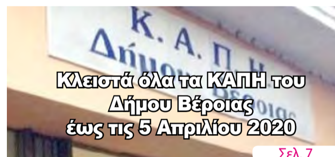
Κλειστά όλα τα ΚΑΠΗ του Δήμου Βέροιας έως τις 5 Απριλίου 2020