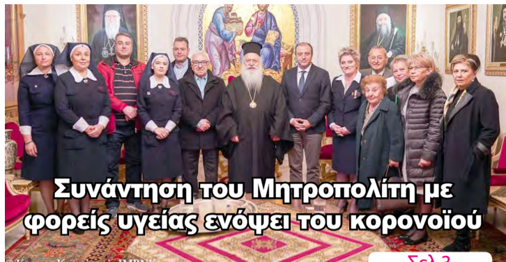
Συνάντηση του Μητροπολίτη με φορείς υγείας ενόψει του κορονοϊού