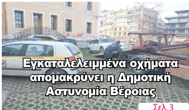
Εγκαταλελειμμένα οχήματα απομακρύνει η Δημοτική Αστυνομία Βέροιας