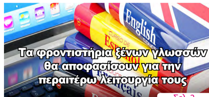
Τα φροντιστήρια ξένων γλωσσών θα αποφασίσουν για την περαιτέρω λειτουργία τους