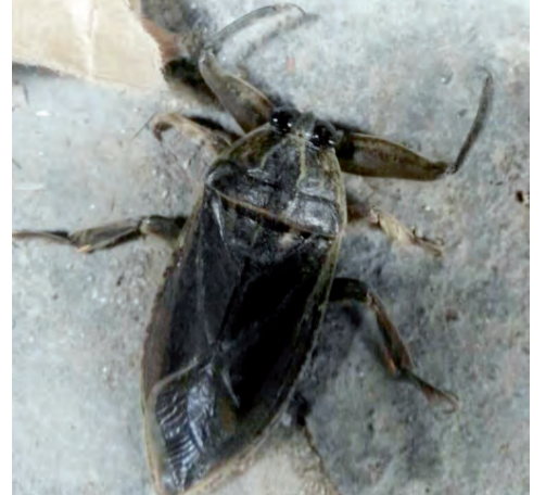
Έντομο στη Βέροια