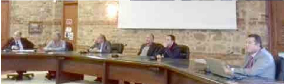
είναι κοντά από την Καρδιολογική της Βέροιας.