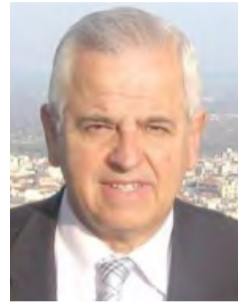
Γράφει ο Αναστάσιος Βασιάδης