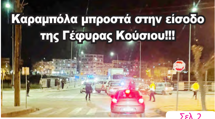
Καραμπόλα μπροστά στην είσοδο της Γέφυρας Κούσιου!!!