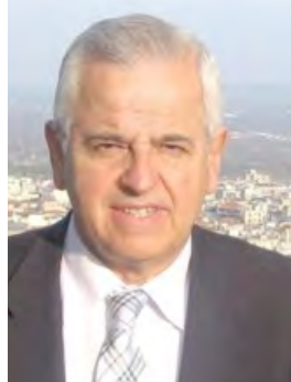
Γράφει ο Αναστάσιος Βασιάδης

Στα πλαίσια των προεκλογικών εξαγγελιών και αντιπαραθέσεων, που είναι αναμενόμενες εν όψει της επικείμενης εκλογικής αναμέτρησης, η οικονομία εγείρεται ως βασικό ζήτημα που αποτελεί τον κοινό και αναγκαίο παρονομαστή όλων των επιμέρους πολιτικών προγραμμάτων.