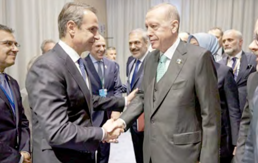
Το καλό κλίμα τονίζει και η Τουρκία

Ο πρωθυπουργός αναφέρθηκε - μεταξύ άλλων - και στη συνάντηση που είχε με τον πρωθυπουργό της Αλβανίας Έντι Ράμα, λέγοντας πως του επανέλαβε ότι πρέπει να επιλυθεί άμεσα το ζήτημα του Φρέντι Μπελέρη, καθώς αφορά το κράτος δικαίου και ότι δεν πρέπει να συμβαίνουν αυτά σε ένα κράτος που θέλει να προσεγγίσει την ΕΕ. «Σέβομαι την ανεξαρτησία της αλβανικής δικαιοσύνης, αλλά το ζήτημα αυτό πρέπει να λυθεί άμεσα», συμπλήρωσε ο κ. Μητσοτάκης.