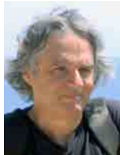
Του Γιάννη Καμπούρη

Πριν από μερικούς μήνες σε νεκρό χρόνο, δημοσίευσα ένα άρθρο σχετικά με τα μουσεία, με αφορμή την έλλειψη ενός συγκροτημένου λαογραφικού μουσείου στην πόλη. Δυστυχώς δεν πέρασε