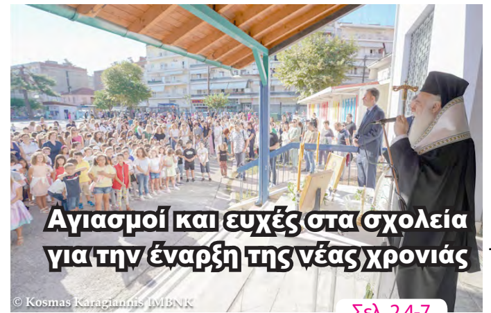
Αγιασμοί και ευχές στα σχολεία για την έναρξη της νέας χρονιάς