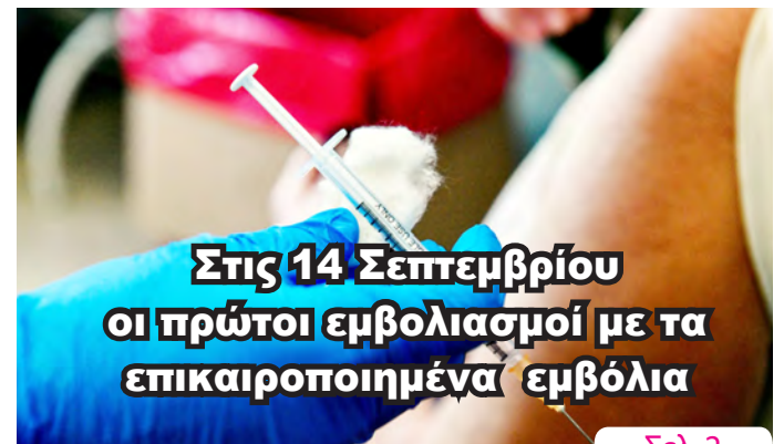
Στις 14 Σεπτεμβρίου οι πρώτοι εμβολιασμοί με τα επικαιροποιημένα εμβόλια