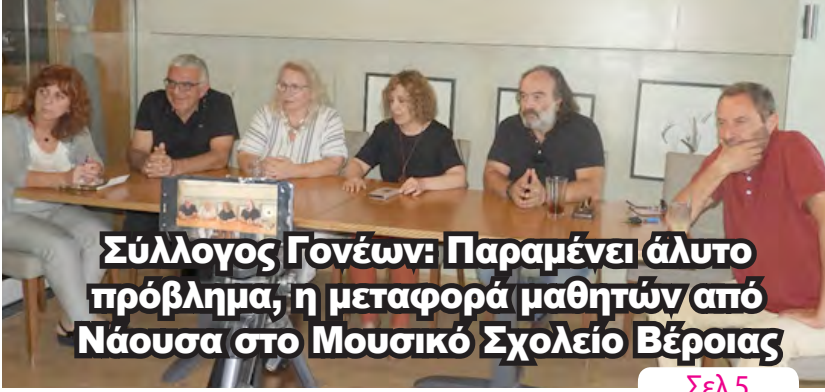
Σύλλογος Γονέων: Παραμένει άλυτο πρόβλημα, η μεταφορά μαθητών από Νάουσα στο Μουσικό Σχολείο Βέροιας