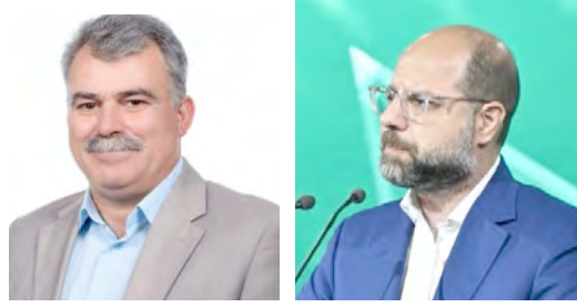
Κλιμάκιο του ΠΑΣΟΚ - ΚΙΝΑΛ σήμερα στην Ημαθία