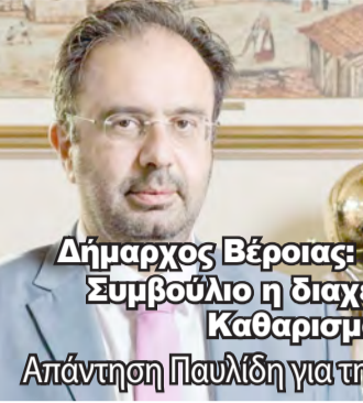
Δήμαρχος Βέροιας: Στο προσεχές Δημοτικό Συμβούλιο η διαχείριση του Βιολογικού Καθαρισμού της ΔΕΥΑΒ