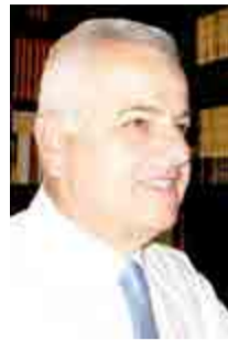
Γράφει ο ΑΝΑΣΤΑΣΙΟΣ ΒΑΣΙΛΑΔΗΣ

Η κατάθεση νομοθετικής τροπολογίας εκ μέρους ομάδας βουλευτών, με την οποία καθορίστηκε συγκεκριμένη ημερομηνία για την διεξαγωγή των αυτοδιοικητικών εκλογών και ενώ ήδη έχει δημοσιοποιηθεί το νομοσχέδιο για το νέο αυτοδιοικητικό πλαίσιο με την κωδική ονομασία «ΚΛΕΙΣΘΕΝΗΣ 1», ήταν αναμενόμενο να προκαλέσει έκρηξη αντιδράσεων, που αναδεικνύονται στην επικαιρότητα των ημερών.