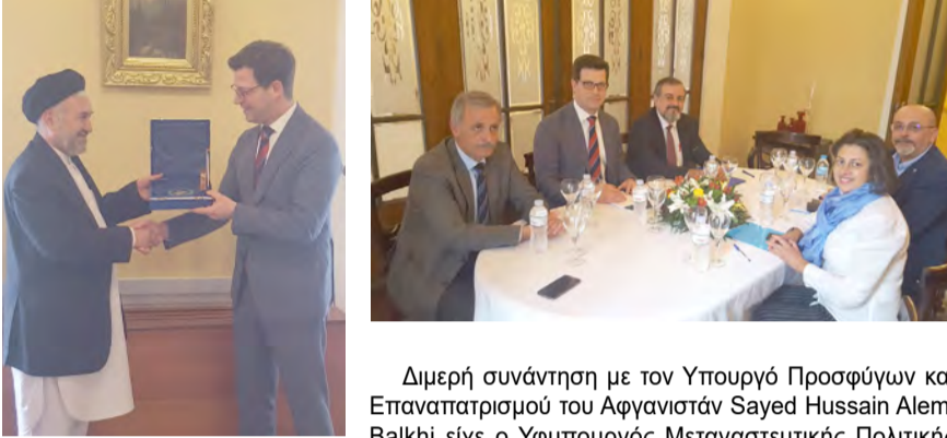
Διμερή συνάντηση με τον Υπουργό Προσφύγων και Επαναπατριsmού του Αφγανιστάν Sayed Hussain Alemi Balkhi είχε ο Υφυπουργός Μεταναστευτικής Πολιτικής Άγγελος Τόγκας.

Η συνάντηση πραγματοποιήθηκε σε θετικό κλίμα με ιδιαίτερη μνεία σε κοινές πολιτικές και ιστορικές αναφορές των δύο λαών. Συζητήθηκαν θέματα αρμοδιότητας των δύο Υπουργείων, καθώς το Αφγανιστάν βρίσκεται στις πρώτες θέσεις των χωρών προέλευσης των αιτούντων άσυλο στην Ελλάδα.