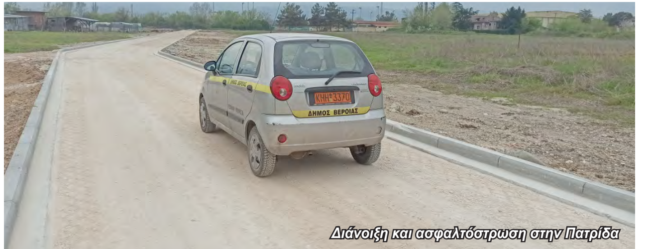
Διάνοιξη και ασφαλτόστρωση στην Πατρίδα