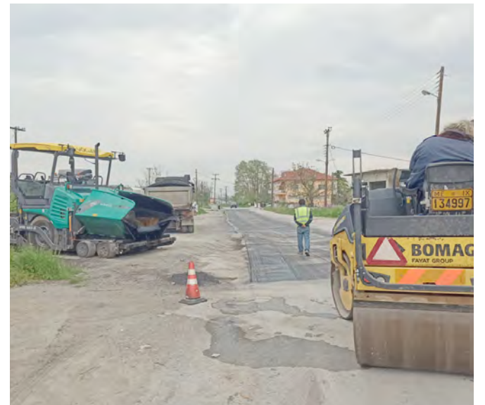
Ασφαλτόστρωση στον δρόμο Βέροια- Λαζοχώρι