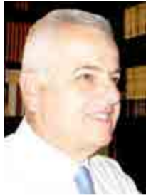
Γράφει ο ΑΝΑΣΤΑΣΙΟΣ ΒΑΣΙΛΙΔΗΣ

Τα δραματικά γεγονότα που κυριάρχησαν στην επικαιρότητα των τελευταίων ημερών, αμαύρωσαν το εορταστικό κλίμα που διαμορφώνεται εν αναμονή των Χριστουγέννων και είχαν ως συνέπεια να αγνοηθεί και η Παγκόσμια Ημέρα Ανθρωπίνων Δικαιωμάτων, που με απόφαση του Οργανισμού