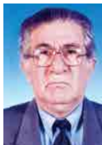
Γράφει ο Παναγιώτης Παπαδόπουλος Φιλολόγος ΜΕΡΟΣ ΙΑ

Όλη η Ελληνική ιστορία αποτελεί ένα απέραντο μωσαϊκό με πολύχρωμα πετράδια. Είναι οι αγώνες των Ελλήνων που υπερασπίστηκαν την πα-