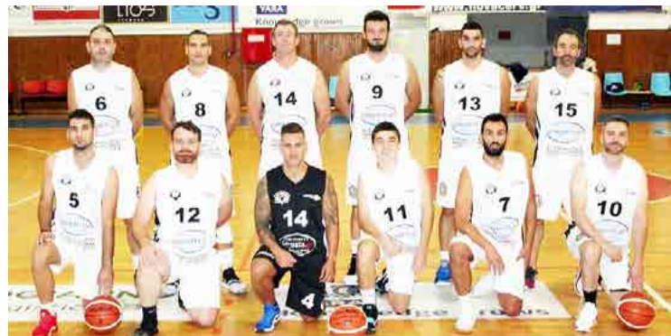
ΦΟ Αριδαίας - Αετοί Βέροιας ΓΑΣ Αλεξάνδρειας - Αετός Κιλκίς ΑΓΕ Πιερίας - Ίκαροι Γιαννισίων (20.00) Ζαφειράκης Νάουσας - Εδεσσαϊκός (20.30) Ρεπό : Μέγας Αλέξανδρος Γιαννισίων