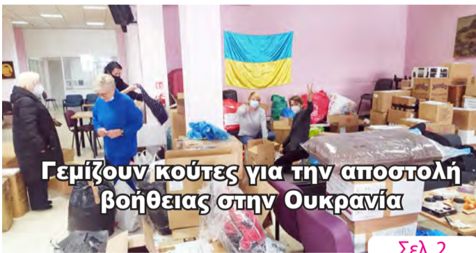
Γεμίζουν κούτες για την αποστολή βοήθειας στην Ουκρανία