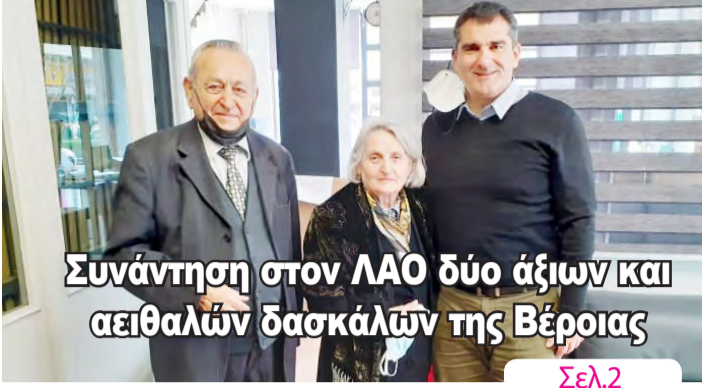
Συνάντηση στον ΛΑΟ δύο άξιων και αειθαλών δασκάλων της Βέροιας