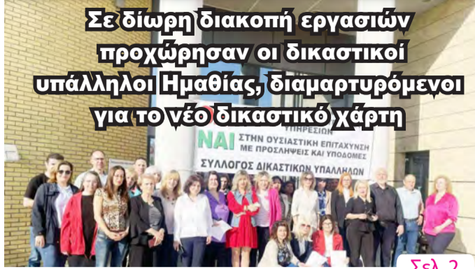
Σε δίωρη διακοπή εργασιών προχώρησαν οι δικαστικοί υπάλληλοι Ημαθίας, διαμαρτυρόμενοι για το νέο δικαστικό χάρτη