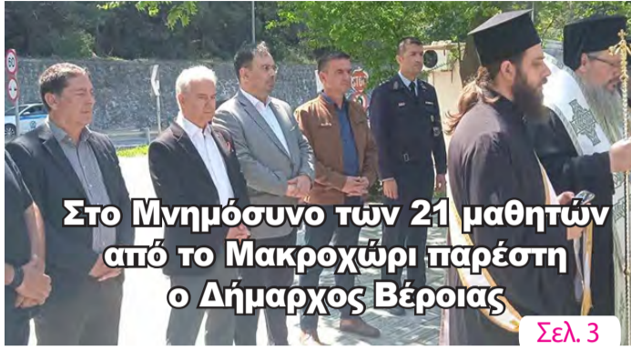
Στο Μνημόσυνο των 21 μαθητών από το Μακροχώρι παρέστη ο Δήμαρχος Βέροιας