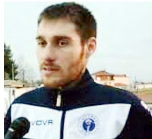
χος τεχνικός είναι κάτοχος διπλώματος ΟΥΕΦΑ Β' ενώ είναι και πτυχιούχος Τ.Ε.Φ.Α.Α.»

Αξίζει να αναφέρουμε ότι ο νεαρός ταλαντού-