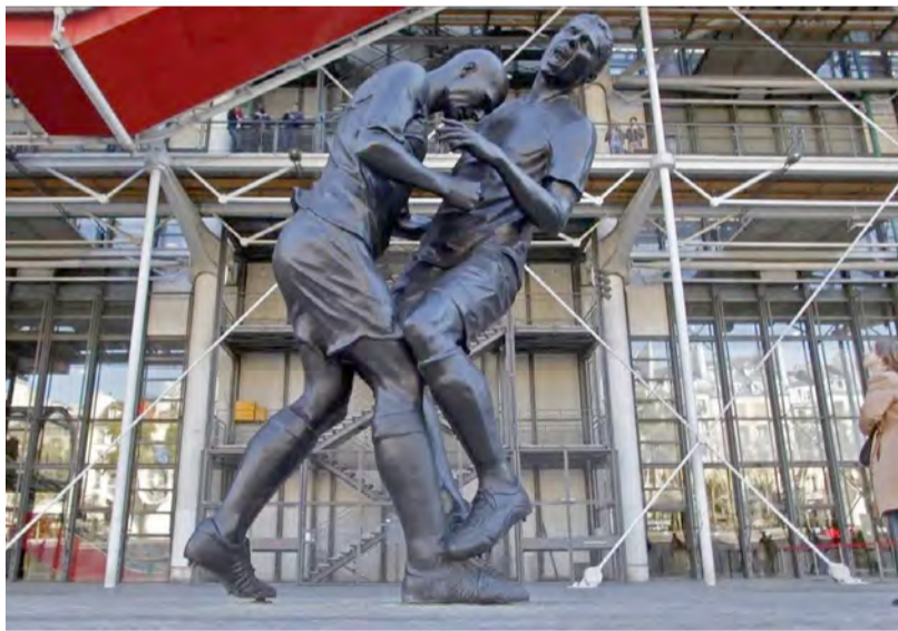
Το άγαλμα της κεφαλιάς μπροστά από το Πομπιντού