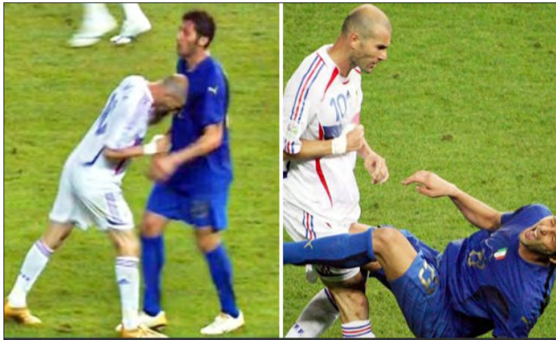
Η πιο διάσημη κεφαλιά στην ιστορία του ποδοσφαίρου