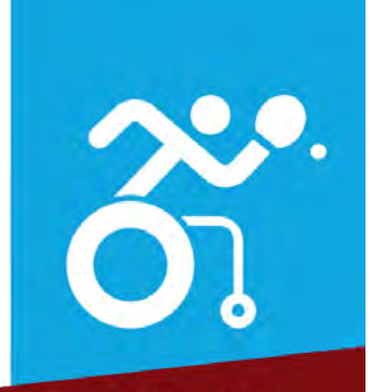
8η Ετήσια Τακτική Απολογιστική Γενική Συνέλευση

Η Γενική Συνέλευση έγινε «δια περιφοράς» μέσω της ηλεκτρονικής πλατφόρμας Zoom Meetings, όπως ορίζεται τόσο από τον αθλητικό νόμο όσο και από το Καταστατικό του σωματείου.