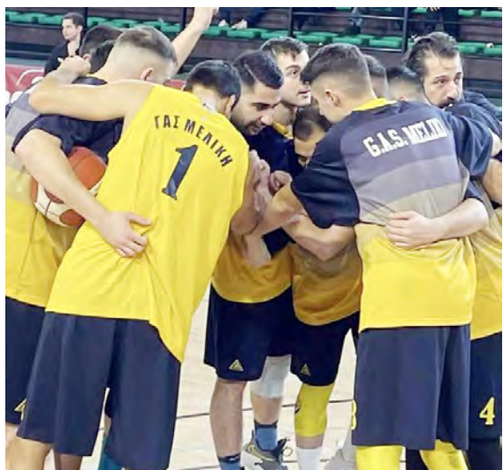
Μπουν στα Playoffs ** οι υπόλοιπες ομάδες θα μπουν στα Playouts

Ο Άθλος Αλεξάνδρειας έχασε εντός έδρας με 67-73 από την Καστοριά, ενώ ο ΓΑΣ Μελίκη ηττήθηκε στην Κοζάνη με 84-78 από τον τοπικό Εθνικό, έχοντας πολλά παράπονα για την διαιτησία!